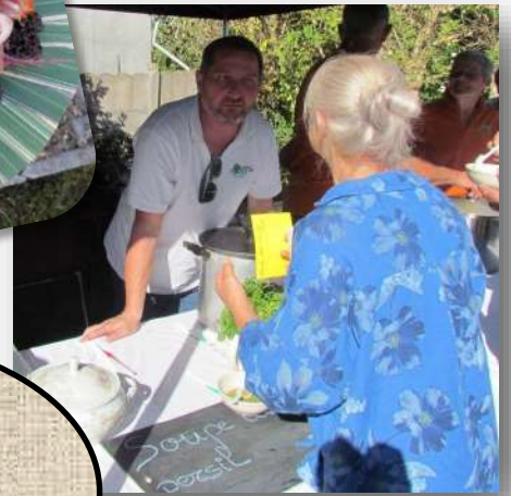
La ronde des soupes