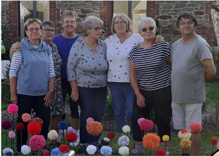
Félicitations et bravo à l'équipe de l'art floral de Pluduno!