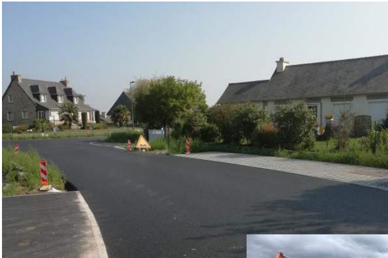
La rue des Trois Croix est bitumée ainsi que les voies piétonnes. Place maintenant à l'aménagement paysager...