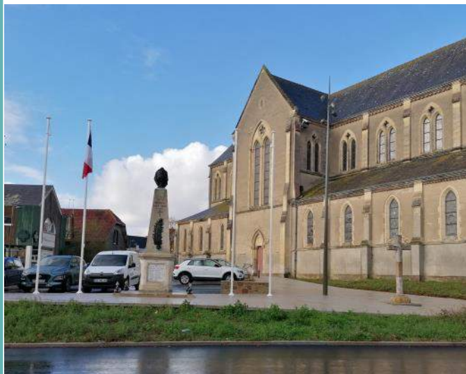
La place de l'Eglise