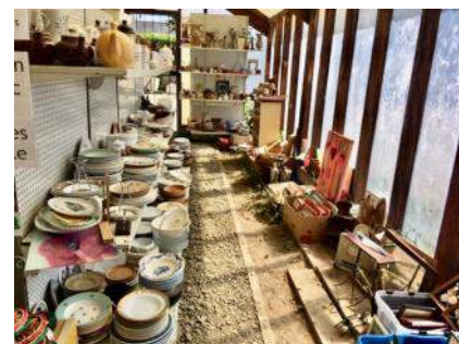
Aménagement de la serre

Si la situation sanitaire le permet, nous avons toujours le projet de proposer des ateliers participatifs visant la réduction des déchets, la prévention du gaspillage et pourquoi pas d'autres activités à la condition qu'elles soient gratuites et ouvertes à tous.