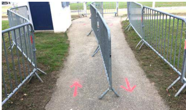
Flux de circulation au stade