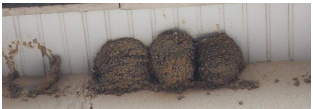
Place du 19 mars 1962 : 3 nids occupés avec traces d'un nid qui s'est décroché