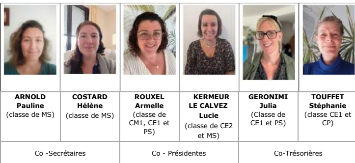
Le nouveau bureau

La nouvelle année s'annonce festive dès le 11 novembre avec la Zumba !