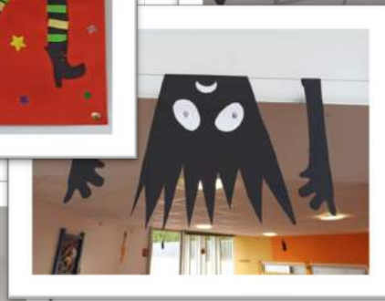
Réalisations des enfants de l'accueil périscolaire