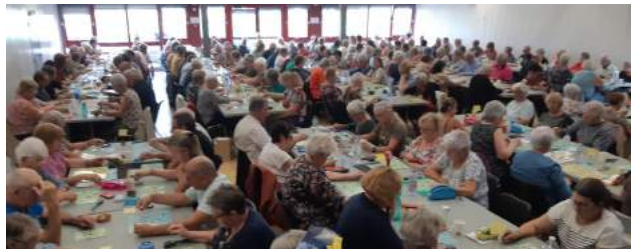
Loto du 16 septembre 2022 : Très belle affluence avec de beaux lots.

Et nous reprendrons le jeudi 5 janvier 2023 à 14 heures à la salle polyvalente.